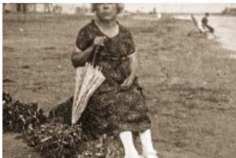
GRAZIA DELEDDA. LA CONFESSIONE I LUOGHI LA