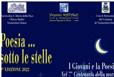
TREMESTIERI ETNEO. POESIA SOTTO LE STELLE: GIO