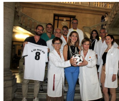
INTELLIGENZA ARTIFICIALE. IL ROLLO DELLO SPC